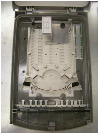
3M MDUO12 non équipé