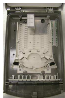
MDUO 12 non équipé