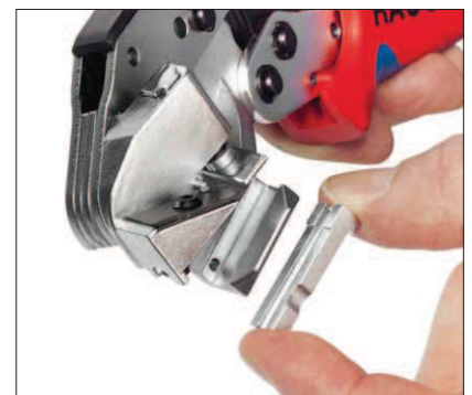
Направляющие для кабеля легко заменяются Easily interchangeable tube guide